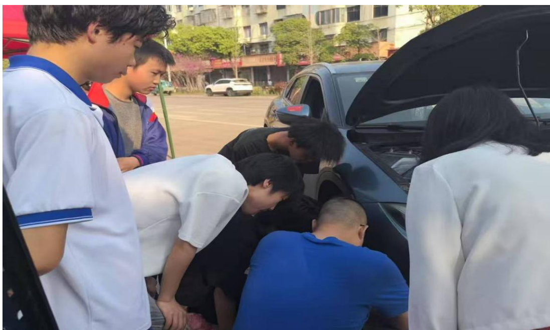
图 8 汽修专业学生给社区居民汽车检测和养护

汽修班学生充分发挥专业所长，将课堂所学转化为服务实效，为当地居民提供汽车便民服务。活动中，学生们认真为居民检测汽车故障，细致排查车辆安全隐患，同时免费为车辆添加玻璃水、检测胎压，耐心告知居民车辆日常保养技巧，帮助居民解决汽车使用中的小问题、小麻烦，以实操技能降低居民用车维护成本，用责任与担当诠释雷锋精神的时代内涵。