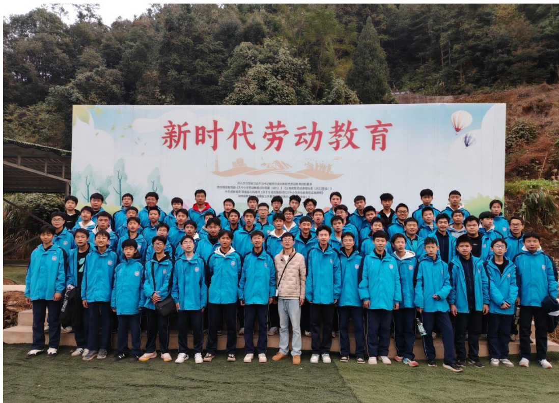
图 11 学生劳动教育合影