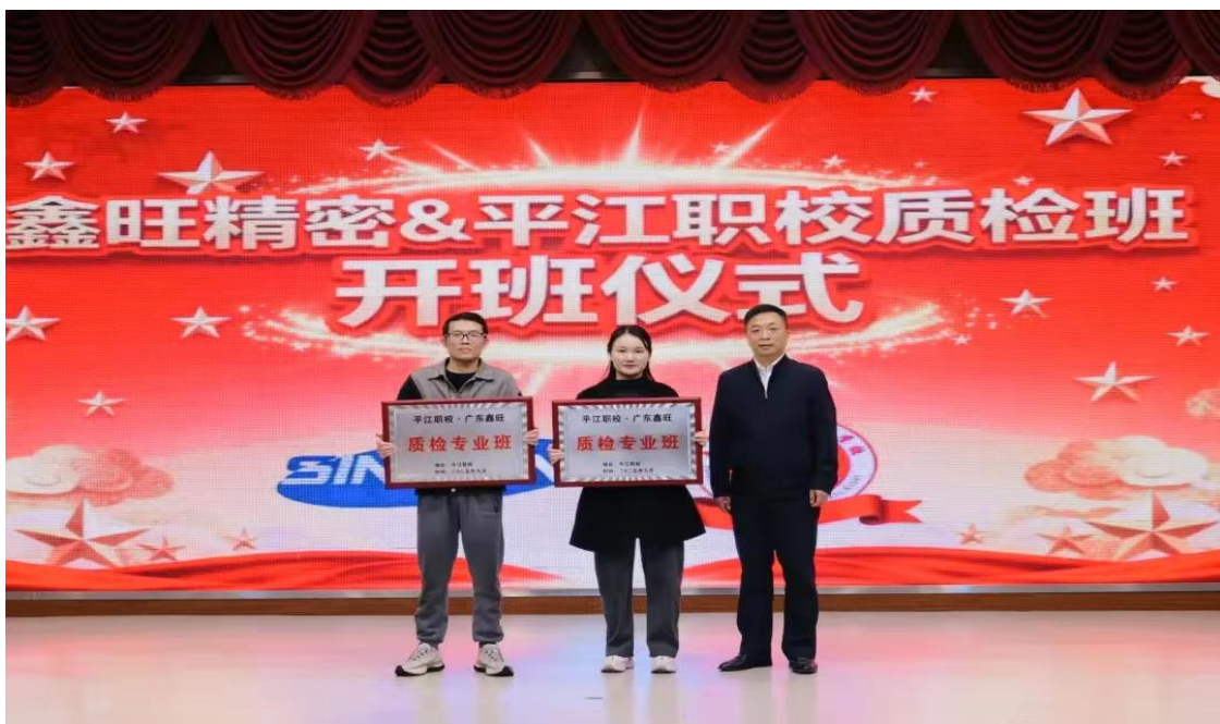
图 21 “鑫旺质检班”开班仪式

提升“双师”能力。课程设置既覆盖国家规定的基础课程，又融入辣条生产工艺、食品安全控制等行业特色内容，并设立企业奖学金激励学生成长。