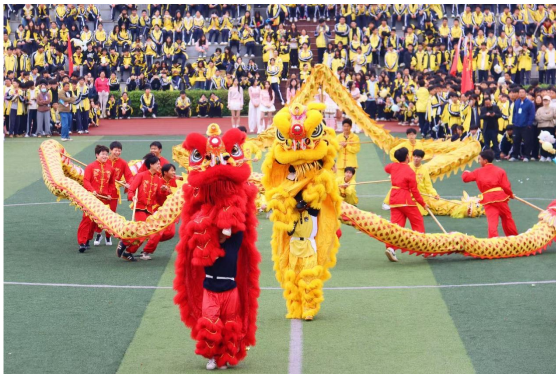
图 17 龙狮社团在学校运动会上表演节目

为深化教学效果，学校搭建“课堂实训+舞台实践”双平台：匠人参与学校大型活动策划，指导学生编排适配场景的表演节目；社团定期开展校内展演，匠人现场点评优化。同时，建立“匠人考评+学生互评”机制，从技艺规范性、文化理解度等维度进行综合评价，确保教学质量。