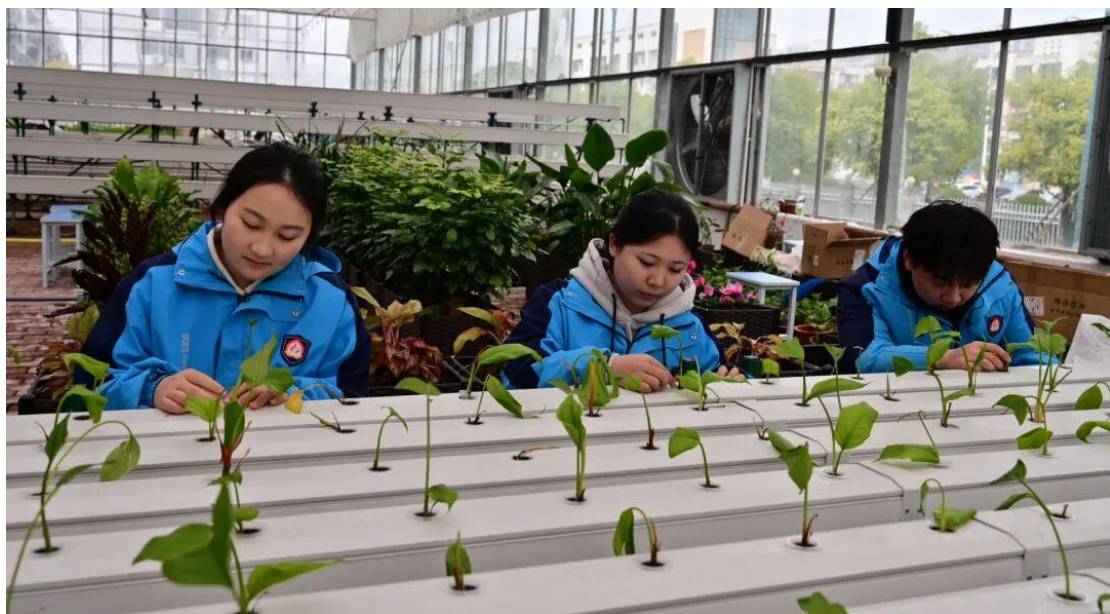
图 9 农艺专业学生在温室大棚实习

园打造为花园式育人环境。计算机专业则以“奶茶视觉设计”等真实商业项目驱动教学，让学生在网站搭建、视觉设计、拍摄剪辑的全链路实战中，真正体验“代码筑就创意”的职业成就感。常态化举办的校级技能竞赛，覆盖导游等 24 个赛项，成为学生切磋技艺、展示风采的重要舞台。