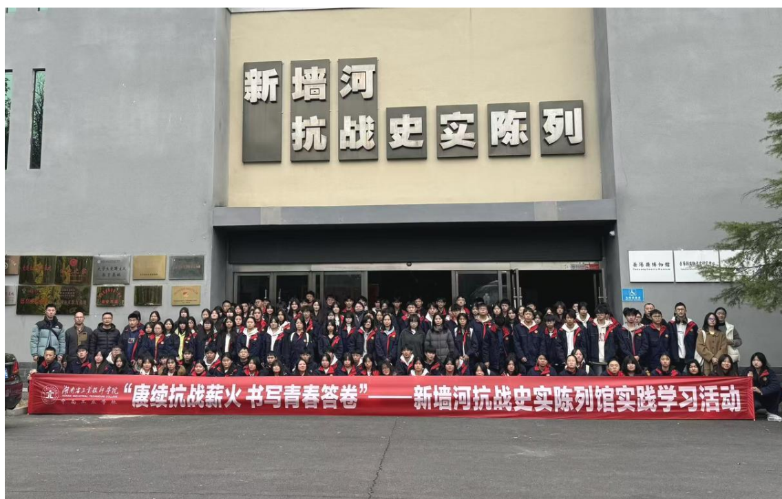
图 1 新墙河抗战史实陈列馆实践学习活动