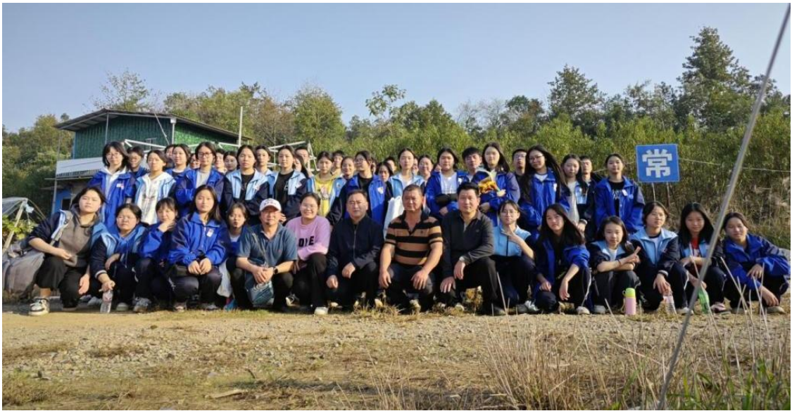
图 14 即将毕业的学生在白马城种养合作社跟岗实习

1.3 服务国家战略，赋能乡村振兴与基层治理： 岳阳市职业教育自觉肩负起服务乡村振兴的国家战略使命，将人才培养的触角延伸至广袤乡村和基层社区。