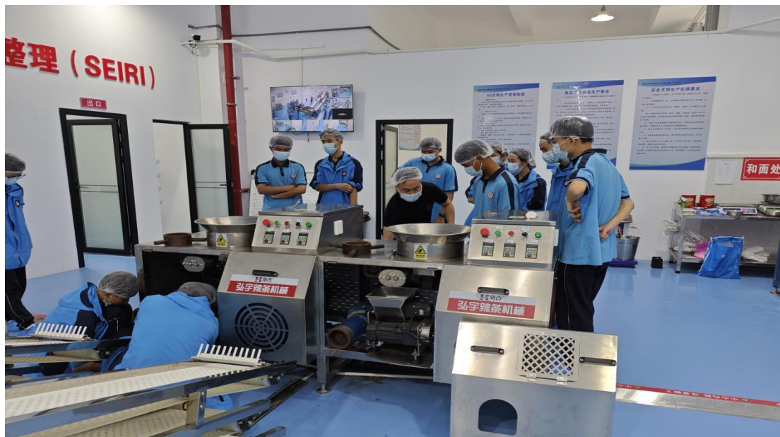
图 15 市赛勇夺一等奖

个月辐射全国，拓外部市场；后续打造服务平台。此创业点子既解决产业难题，也为职校创新创业教育提供实践标杆。