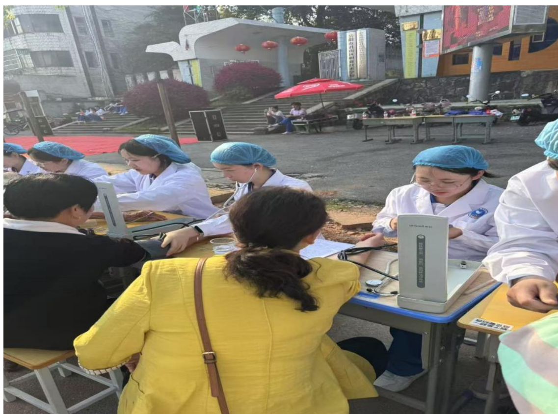
图 7 护理专业义诊服务掠影

护理专业义诊服务护民生，健康帮扶暖人心以扎实的专业技能开展便民服务。活动现场，师生分组有序为当地居民免费测血糖、量血压，细致记录检测数据，针对不同年龄段居民的身体状况，耐心讲解高血压、糖尿病等常见疾病的预防要点，分享科学的饮食搭配、日常运动建议，同时解答居民各类健康疑问，帮助群众树立正确健康理念，缓解基层群众日常健康咨询不便的难题，用专业守护群众身体健康。