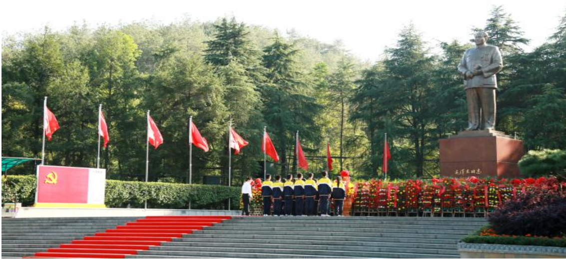
图 5 学生代表向毛主席铜像敬献花篮