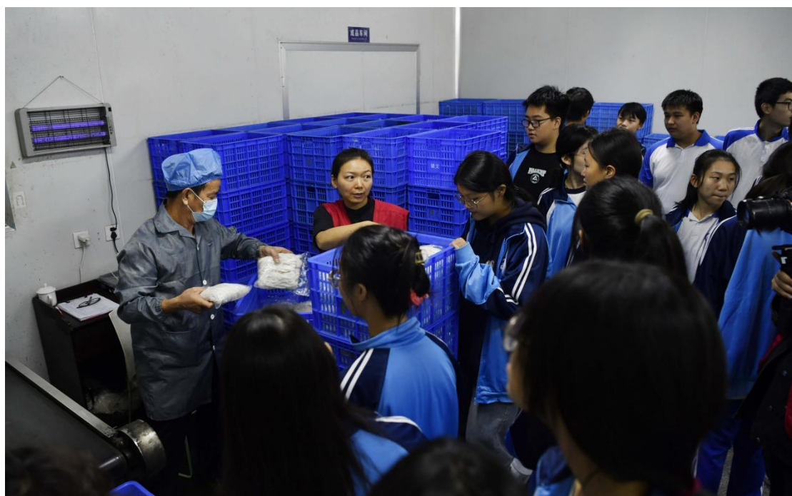
图 20 学生到食品企业开展见习活动

校企共同制定人才培养方案，共建课程体系，共组教学团队，实现“招生即招工、入校即入企”的培养模式创新。这种深度融合机制不仅提升了人才培养的针对性，也为企业储备了优质技术人才，形成了良性循环。