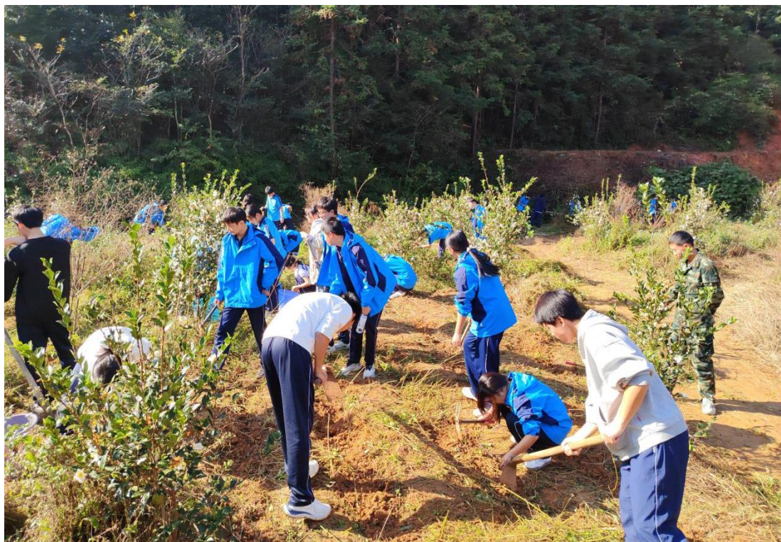
图 12 学生劳动实践