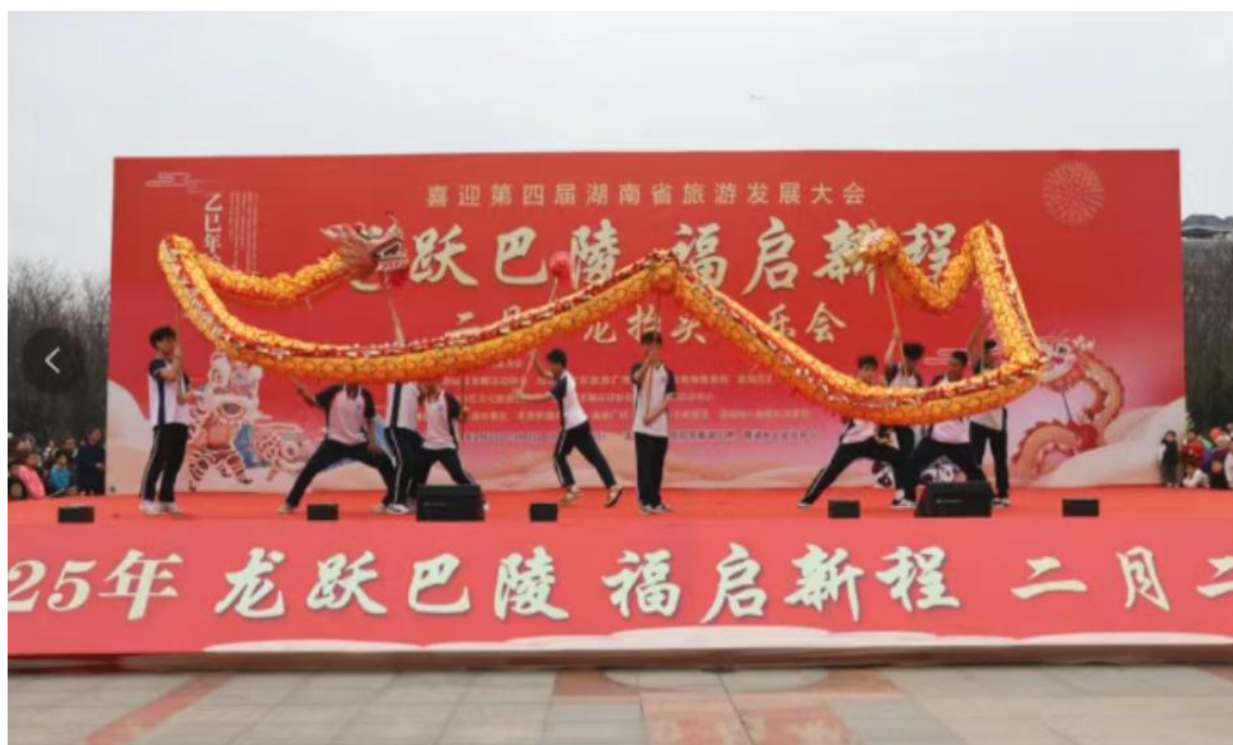
图 4 学校体育武术舞龙舞狮社团参加“龙抬头”民俗活动