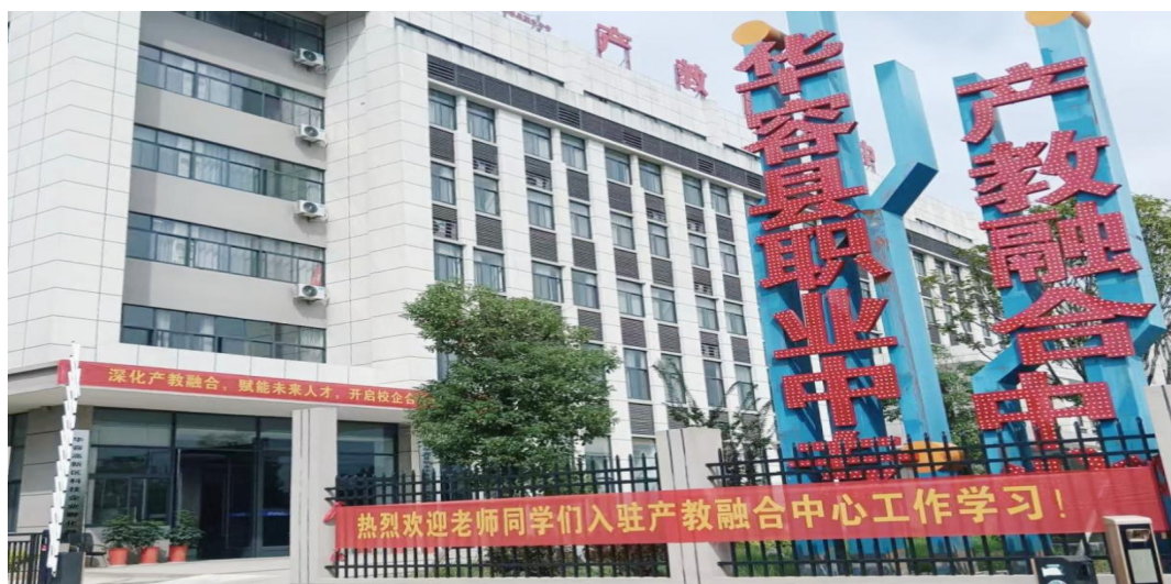
图 19 华容县职业中专产教融合中心

2025 年，华容县职业中专产教融合机制建设实现重要突破，形成了“共建、共管、共享”的校企协同新格局。学校与三家优质企业建立了深度战略合作关系：与湖南健文食品有限公司共建食品安全检测实践基地，与岳阳璟祥电子科技有限公司共建物联网与电子技术应用实践基地，与湖南沁峰机器人有限公司深化现代学徒制合作。这些合作标志着容县职业中专产教融合从项目式合作向体系化共建转变。