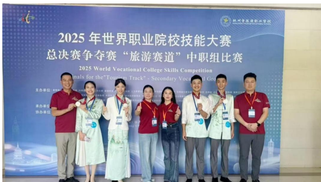
图 13 学生参加省级职业技能大赛现场

水平。通过将竞赛标准转化为教学标准、竞赛内容融入课程体系，学校形成了“教学-训练-竞赛-反馈”的良性循环，有效促进了“双师型”教师队伍建设，改善了实训条件，激发了学生的学习热情。近三年，学校在世界职业院校技能大赛中获得银奖 3 枚、铜奖 2 枚，在全国职业院校技能大赛中获一等奖 1 项、二等奖 2 项，在省级技能大赛中获一等奖 14 项，并连续三年承办湖南省“楚怡杯”职业院校技能大赛植物嫁接、农机检修赛项。这一实践将竞赛成果有效转化为教学资源，形成了“人人练技能、层层抓竞赛”的良好氛围。