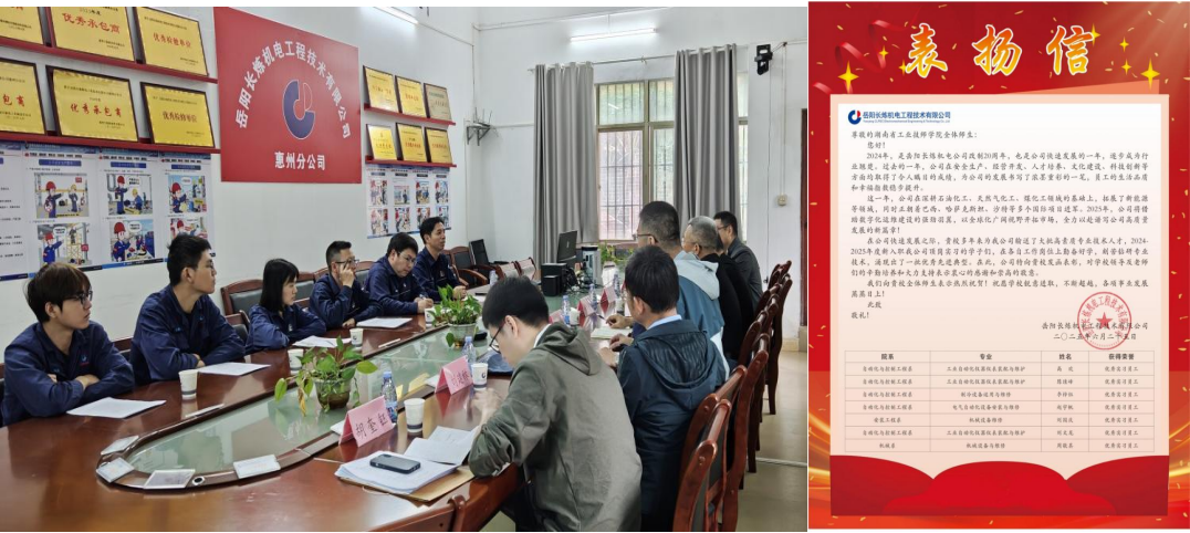
图 18 岳阳长炼机电工程技术有限公司惠州分公司及表扬信

深度合作的优质伙伴，建立了深厚的互信与协同育人机制。长炼机电每年固定参与中南工业学校双选会，近五年年均录取毕业生超过 65 人。2025 年 5 月，企业根据 9 家分公司需求，定向招聘录用中南工业学校安装、电气、焊接、机修、仪表等专业毕业生 69 名，岗位匹配度达 100%。公司为每一位新入职的毕业生精心指派经验丰富的导师，签订“师徒协议”，实施一对一全程指导。企业通过明确的技能晋升通道、定期的技术培训和公平的绩效激励，确保毕业生成长有方向、提升有路径、生活有保障，极大地增强了员工的归属感与发展信心。中南工业学校每年组织招生就业科、系部负责人及专业教师赴长炼机电各地分公司进行实地走访。通过参观生产现场、组织毕业生座谈会、与企业技术及人事部门面对面交流等形式，学校直接掌握了产业技术升级的最新动态和企业的具体人才需求，同时深入了解毕业生的工作状态与发展诉求，针对性调整人才培养方案，精准对接企业需求，优化专业课程与教学内容。