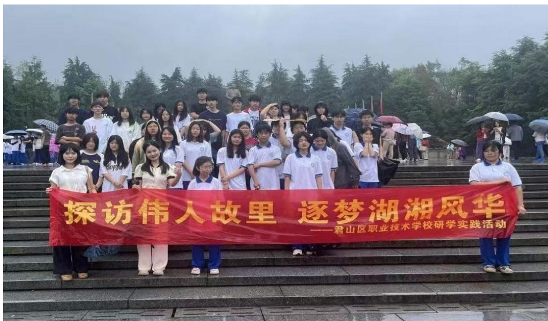
图 16 韶山行研学活动掠影

研学活动后，通过“红色故事分享会”“研学心得征文比赛”等形式，引导学生梳理感悟。学校还将优秀心得汇编成《红色研学手记》，在校园内展示传播，让学生从“被动聆听”转变为“主动传播”，深化对革命精神的理解与认同。