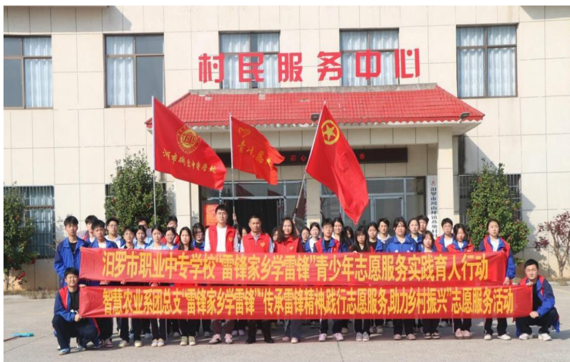
图 3 校志愿者服务团队志愿服务活动