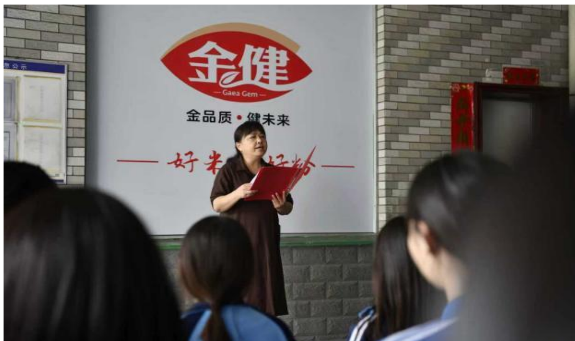
图 2 产教融合中心学生见习活动