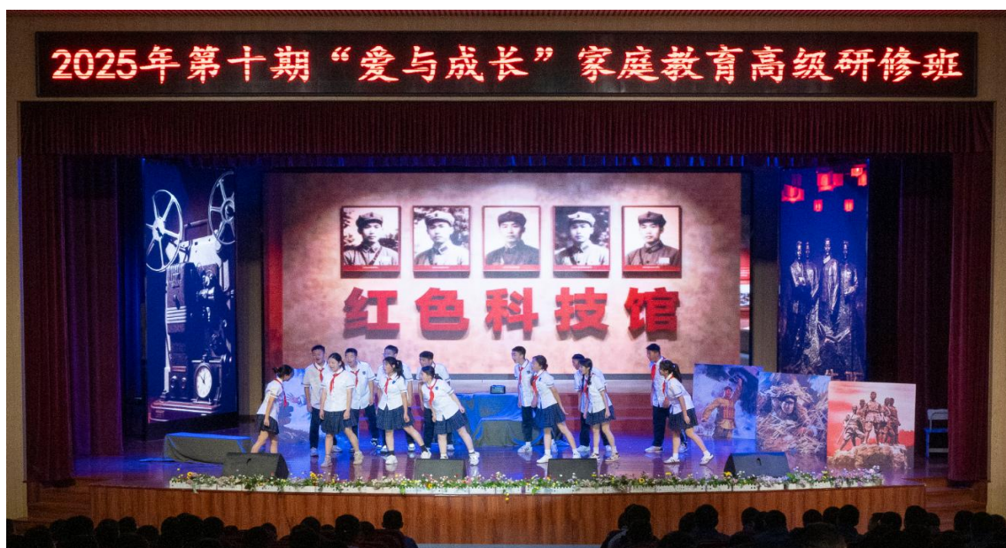
图 6 学生代表向毛主席铜像敬献花篮

“一班一剧”考核作为岳阳市春雷学校的常规活动项目，不仅强健了学生的体魄，提升协作能力，还深深植根了团队精神和竞争意识，更极大地提高了学生的艺术鉴赏与审美能力。这些丰富多彩的活动，为校园营造了一种积极向上的文化氛围，有力地推动了校本特色课程的打造，并成功践行了“兴趣引导、活动育人”及“亲情式教化、体验式教学”的教育理念。春雷学校将继续以月度考核为抓手，不断检验教育教学常规，专注专门教育的高质量发展，与家庭、社会共同呵护青少年健康成长。